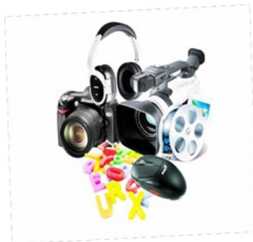
PLANO DE ESTUDOS

O/A Técnico/a de Multimédia é o profissional qualificado para exercer profissões ligadas ao desenho e produção digital de conteúdos multimédia e para desempenhar tarefas de caráter técnico e artístico, com vista à criação de soluções interativas de comunicação.