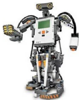
PLANO DE ESTUDOS

O/A Técnico/a de Mecatrónica é o profissional qualificado para orientar e desenvolver atividades na área da manutenção de equipamentos eletromecânicos e eletrónicos.